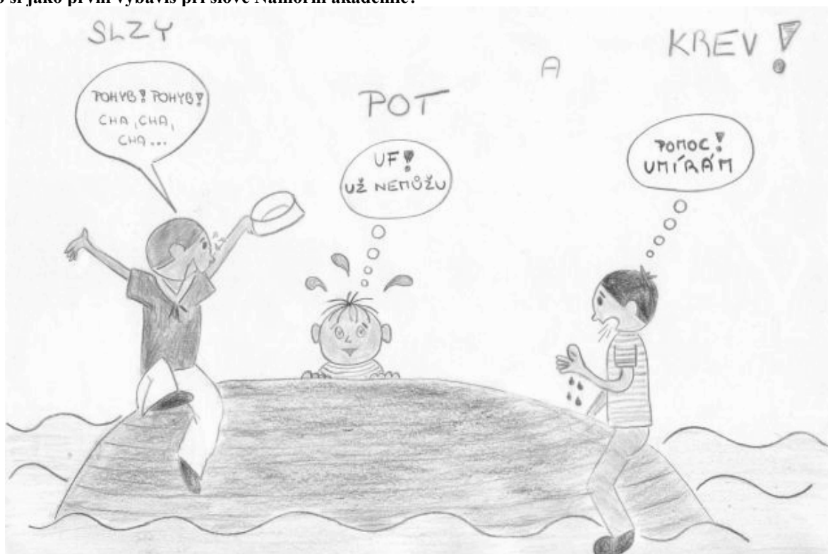
Vodénka z Jablonce n.N

Co si jako první vybavíš při slově Námořní akademie?